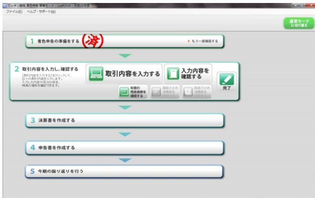
【画面例 (簡単モード・メニュー画面)】