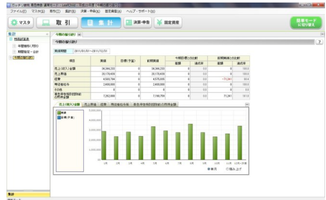
【画面例 (今期の振り返り)】